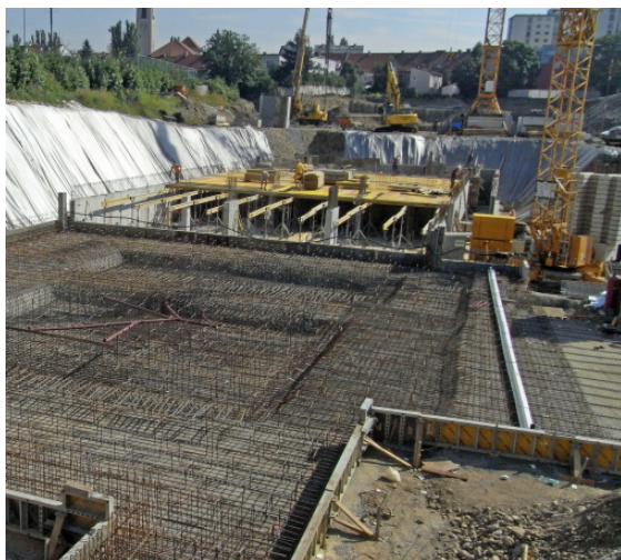
Messequartier Graz – Bodenplatte

Im August 2009 haben für die BAUER Baustahl GmbH die Bewehrungsarbeiten bei der derzeit wohl größten Baustelle in Graz begonnen. Es handelt sich hierbei um den Neubau des Messequartiers Graz – einem Komplex von Wohnungen, Geschäfts- und Gewerbeflächen im Bereich der Messe Ost. In den Monaten August bis Dezember wurden von unserem Personal bei diesem Bauvorhaben an die 4.000 Leistungsstunden erbracht, was 10% der Jahresleistungsstunden entspricht.