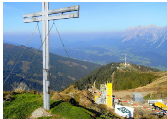
Lifanlage Märchenwiese – Hauser Kaibling

Ein weiteres interessantes Bauprojekt im alpinen Bereich, war die Ausführung der Bewehrungsarbeiten im Bereich der Lifanlage Märchenwiese am Hauser Kaibling inmitten der Region Schladming Dachstein Tauern. Auch bei diesem Bauvorhaben trug unser Personal zur Verwirklichung einer Lifanlage bei.